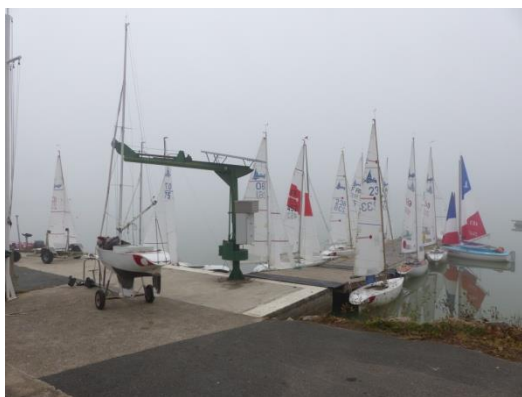
Brume matinale sur le plan d'eau

Cette année ce sont 22 coureurs, dont 3 féminines, venus de PACA, de la Nouvelle Aquitaine et d'Occitanie qui ont disputé 2 jours de régata.